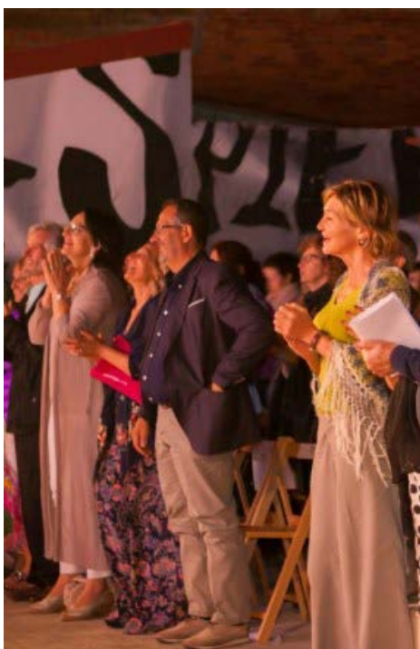
LUNA DE CORTOS